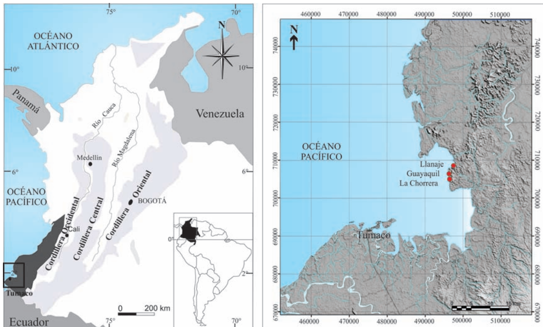
FIGURA 1. Localización geográfica y límites de la cuenca Tumaco onshore (gris oscuro). A la derecha, zoom del mapa con la localización de las secciones estudiadas.

La cuenca de antearco Tumaco onshore se localiza al SW de la provincia costera del Pacífico colombiano (FIGURA 1). Un nuevo estudio desarrollado en esta área por la Agencia Nacional de Hidrocarburos y la Universidad de Caldas en 2011, presenta la descripción detallada de varias secciones estratigráficas localizadas en los acantilados de la bahía de Tumaco, hacia el norte del municipio de Tumaco. Estas secciones comprenden las sedimentitas de la Formación San Agustín (Mioceno superior), compuestas principalmente de espesas sucesiones de limolitas bioturbadas, arcillolitas masivas y margas, intercaladas con algunas areniscas turbidíticas de grano medio (Borrero et al. , 2012).